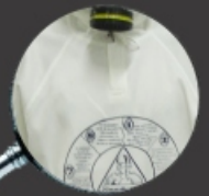
Patô e mangas raglan

A linha Agro DX trata-se de vestimentas do tipo conjunto direcionadas a aplicação de agrotóxicos.