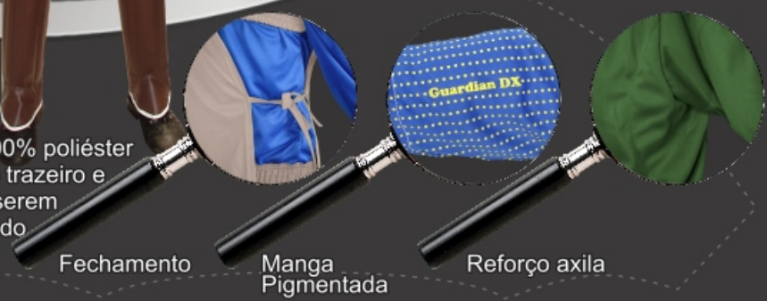
Fechamento Manga Pigmentada Reforço axila

Os conjuntos para rurícola são produzidos em 100% poliéster malha trançada compostos por calça com bolso trazeiro e camisa manga longa simples, podendo estas serem doubladas com gramatura leve ou pesada dependendo do tipo de utilização.