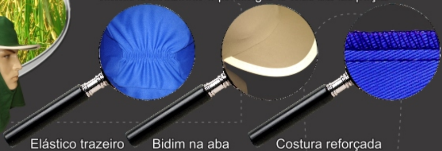
Elástico trazeiro Bidim na aba Costura reforçada

Toucas modelos Árabe e Soldador produzidas em helanca trançada 100% poliéster e brim, fita de poliéster 3 cm no interior para aumentar o conforto do usuário e abas com proteção em bidim. Os processos de costura utilizando ponto cadeia de forma a fortalecer e prolongar a vida útil da peça.